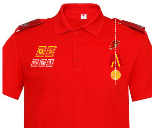
Размещение знаков различия, знаков отличия и иных геральдических знаков на рубашке поло красного (синего) цвета