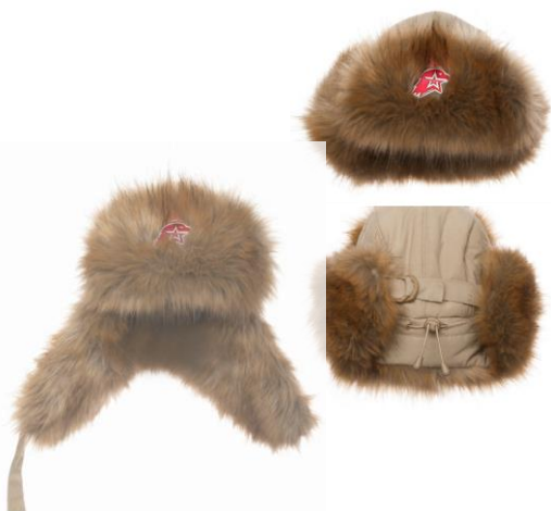
Шапка-ушанка бежевая с искусственным мехом коричневого цвета