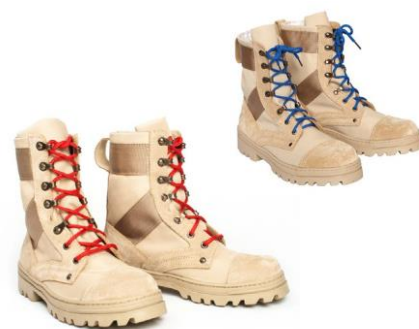
Ботинки высокие берцами утеплённые бежевого цвета со шнурками красного (синего, бежевого) цвета