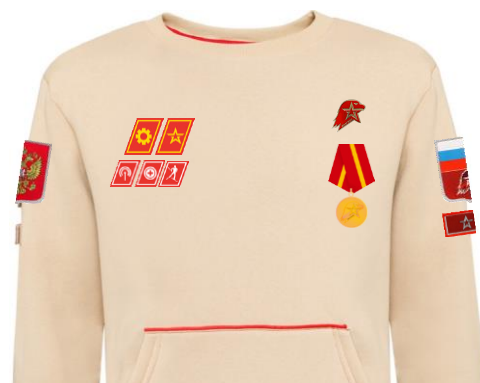
Размещение знаков различия, знаков отличия и иных геральдических знаков на толстовке бежевого цвета