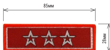
Нарукавный знак, определяющий принадлежность к ВВ под «ЮНАРМИЯ»