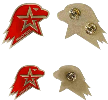
Большая (кокарда) и малая (значок) эмблема ВВ под «ЮНАРМИЯ»