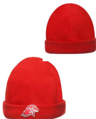
Шапка флисовая вязаная красного цвета