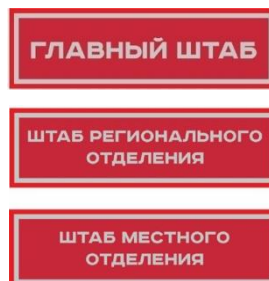
Нарукавный знак, устанавливающий принадлежность к структуре органов ВВ под «ЮНАРМИЯ»