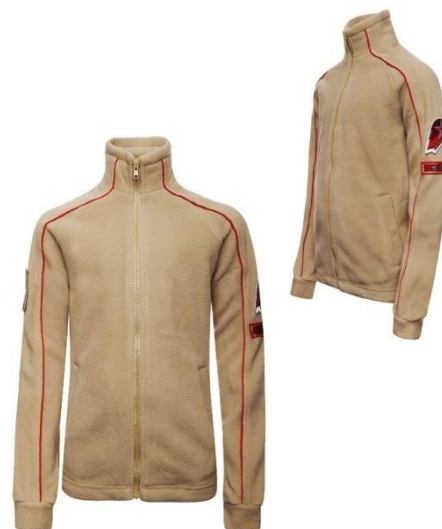
Жакет флисовый бежевого цвета