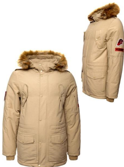
Куртка зимняя утеплённая бежевая с капюшоном и отделкой к капюшону из искусственного меха коричневого цвета