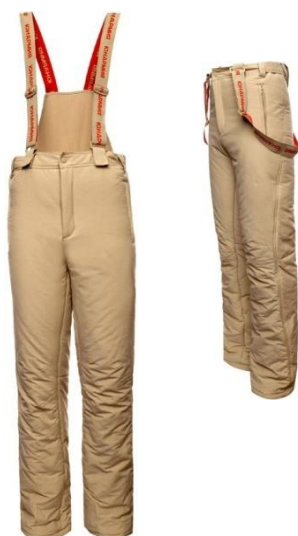
Брюки утеплённые (тактические) бежевого цвета